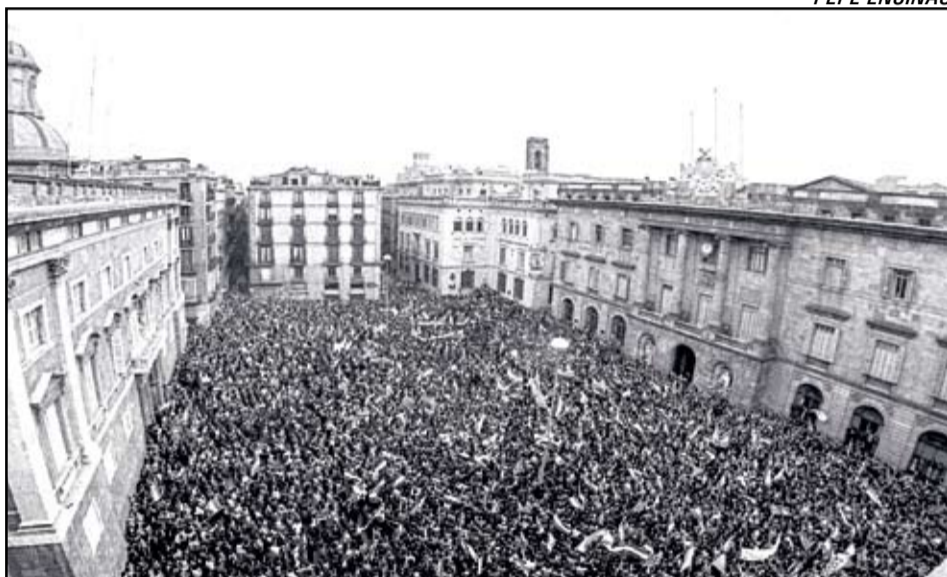
La manifestación del 4 de diciembre de 1977 en Barcelona congregó a 300.000 personas que abarrotaron la plaza de Sant Jaume.