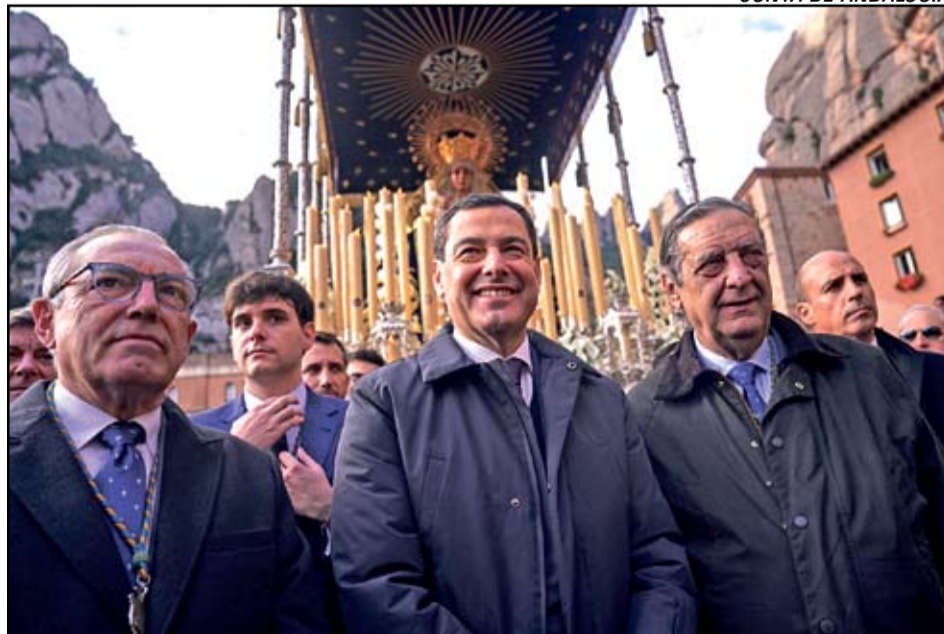
El presidente de la Junta de Andalucía, Juanma Moreno, acudió a la peregrinación de la Hermandad de Montserrat de Sevilla a la Abadía.