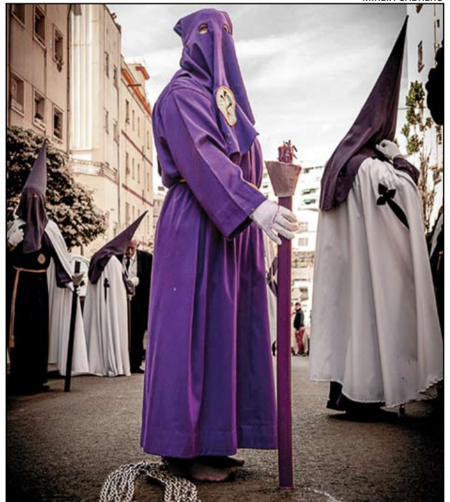
Tercer premio en la categoría "Catalunya cofrade": "Promesa", de Mireia Cabrero.