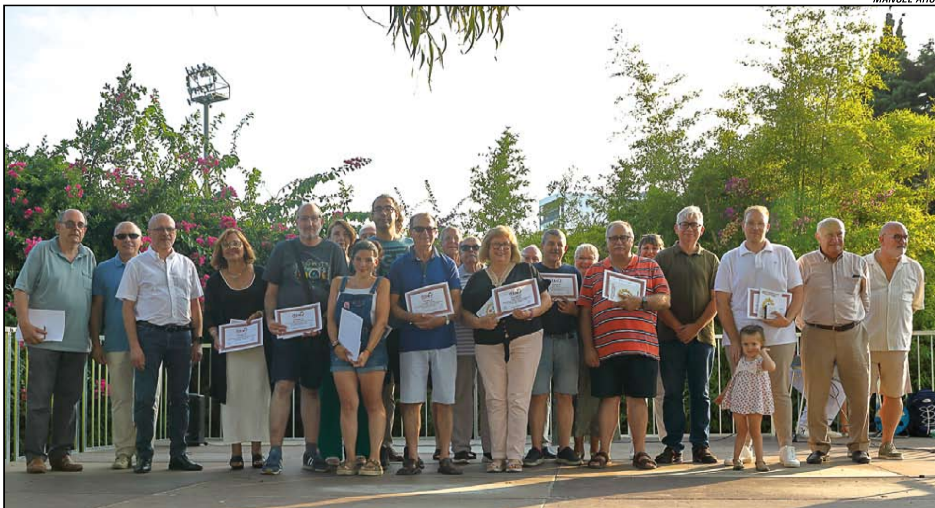
Premiados y autoridades presentes en el acto de entrega de los premios del XIX Concurso de Fotografía Rociera del CERCAT.