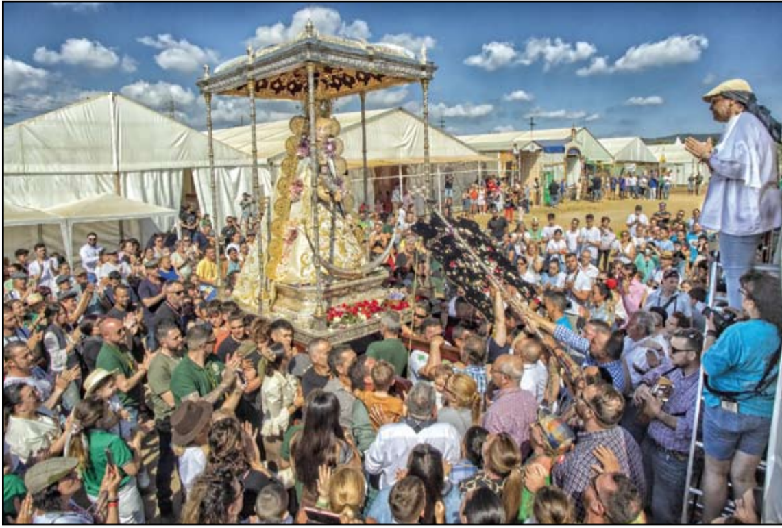
Tercer premio en la categoría "Romería del Rocío": "Cantando a la Virgen", de Agustín Padilla.