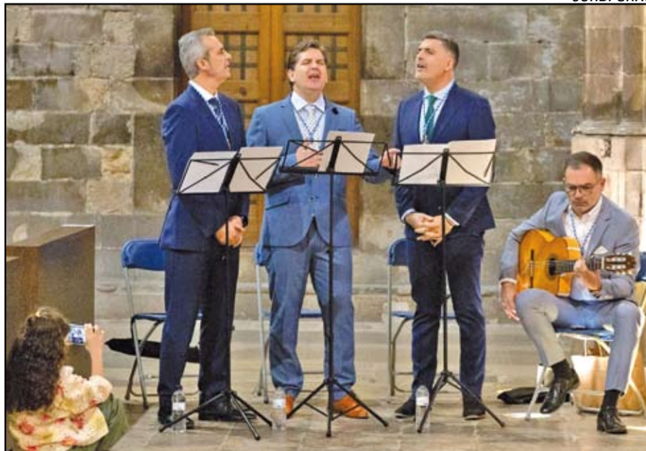
El grupo almonteño Senderos actuó en la ceremonia por el 40 aniversario de la Hermandad Ntra. Sra. del Rocío de Pineda de Mar en la catedral de Girona.