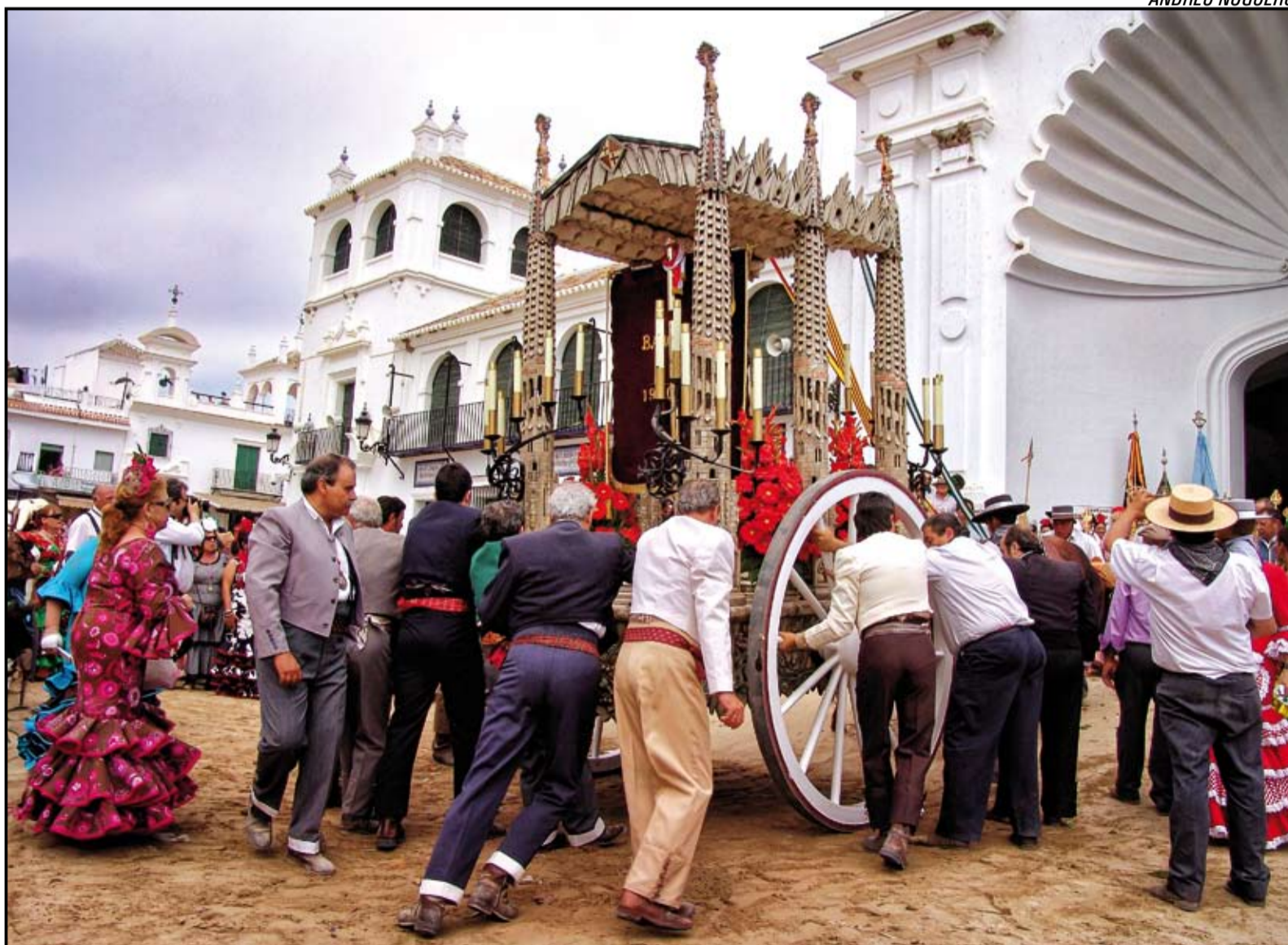
Primer premio en la categoría "Romería del Rocío": "A la presentación", de Andreu Noguero.