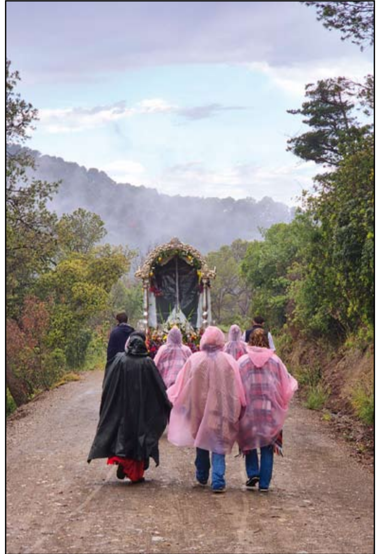
Cuarto premio en la categoría "Romería del Rocío": "Chaparrones de mayo", de Silvia Romero.