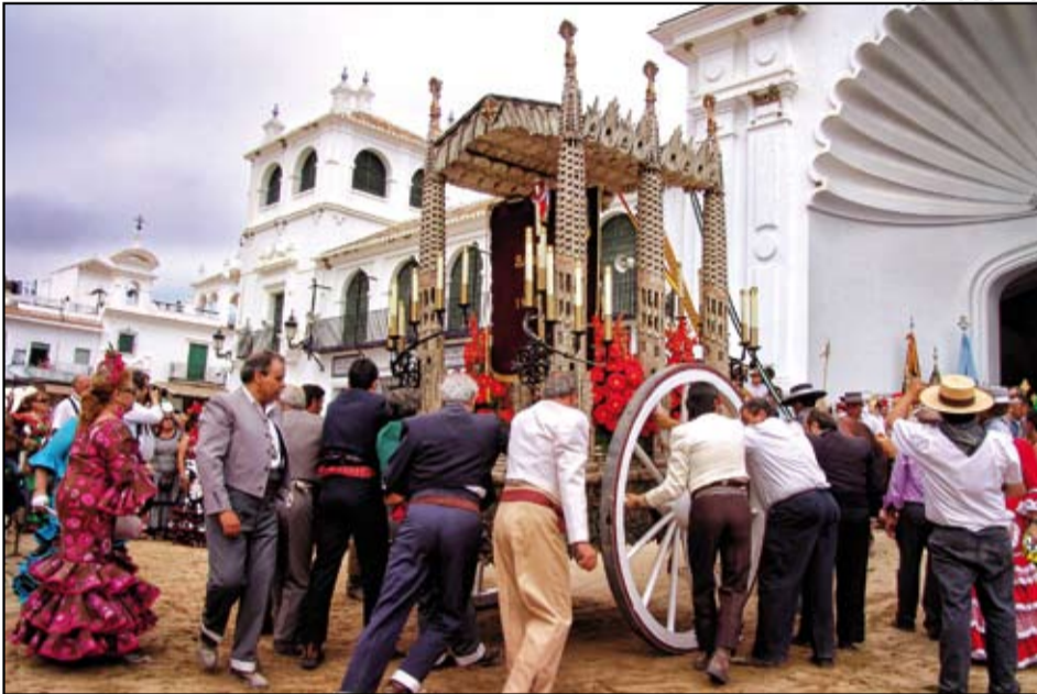
Primer premio en la categoría "Romería del Rocío": "A la presentación", de Andreu Noguero.