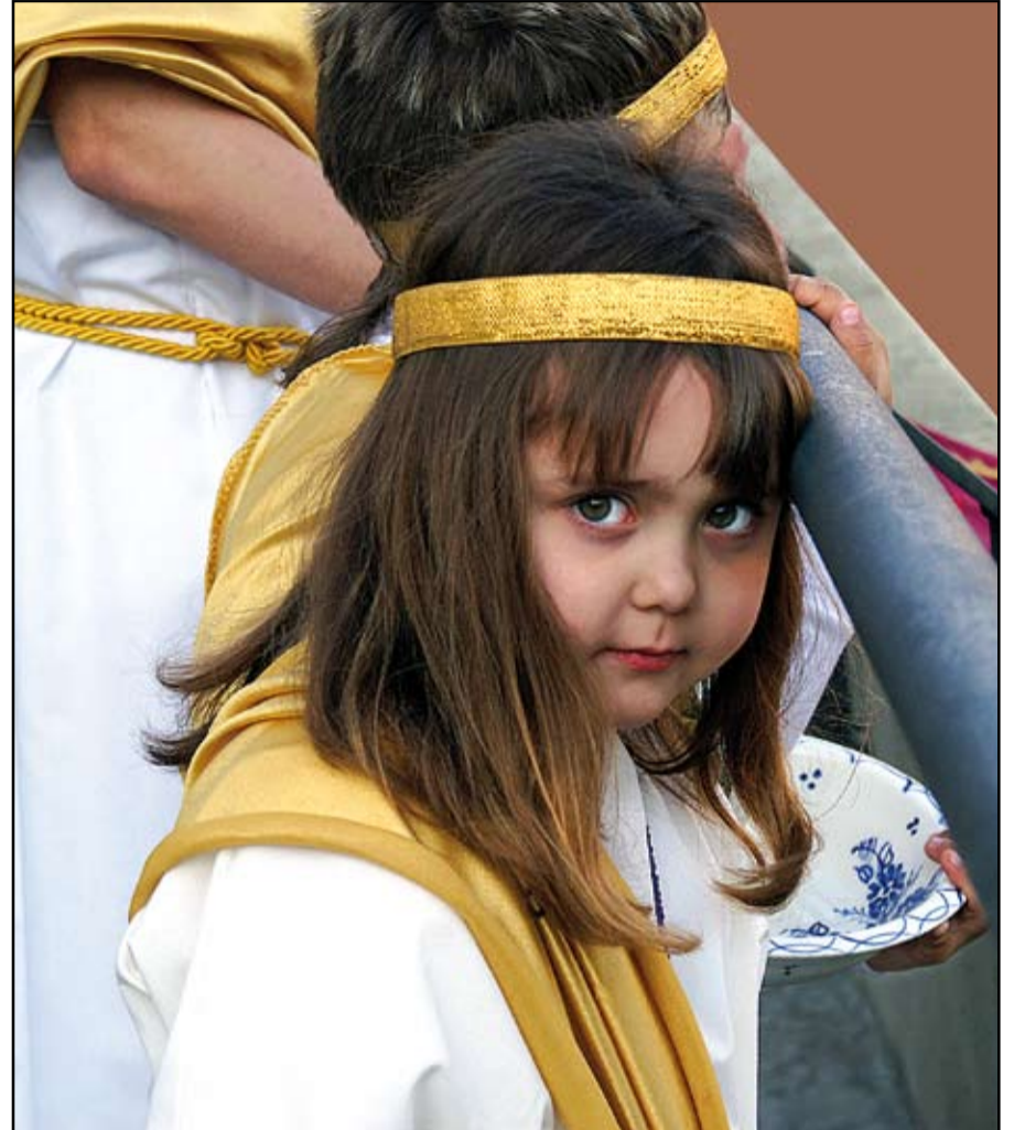
Tercer premio en la categoría "Catalunya cofrade": "Ángel", de Domènec López.