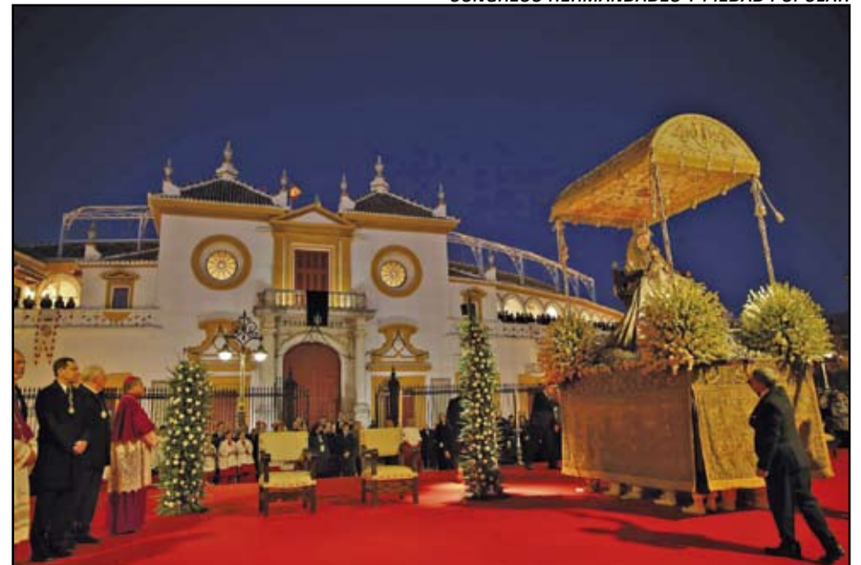
CONGRESO HERMANDADES Y PIEDAD POPULAR

Además de los actos del propio congreso, se desarrollaron actividades culturales paralelas, como una exposición sobre los vínculos entre la piedad popular de Sevilla y la de Andalucía, España y el resto del mundo. El día de la clausura, el 8 de diciembre, tuvo lugar una procesión por las calles de la capital hispalense con la participación de las imágenes de Nuestro Padre Jesús del Gran Poder, Santísimo Cristo de la Expiración (Cachorro), María Santísima de la Esperanza Macarena, Nuestra Señora de la Esperanza de Triana, Nuestra Señora de Valme (Dos Hermanas), Nuestra Señora de Consolación (Utrera), Nuestra Señora de Setefilla (Lora del Río) y la patrona de Sevilla y su Archidiócesis, Nuestra Señora de los Reyes.